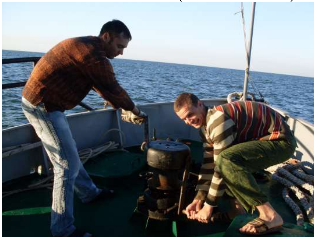
начало экспедиции – якорь поднять!