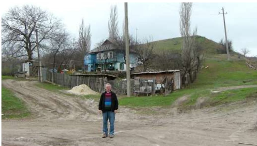
в казачьей станице...