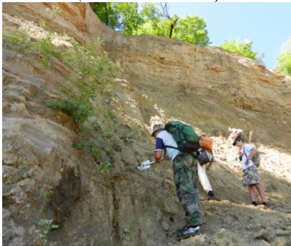
Обследование верхнемиоценовых отложений по берегам р. Белая в окрестностях г. Майкоп (Адыгея).