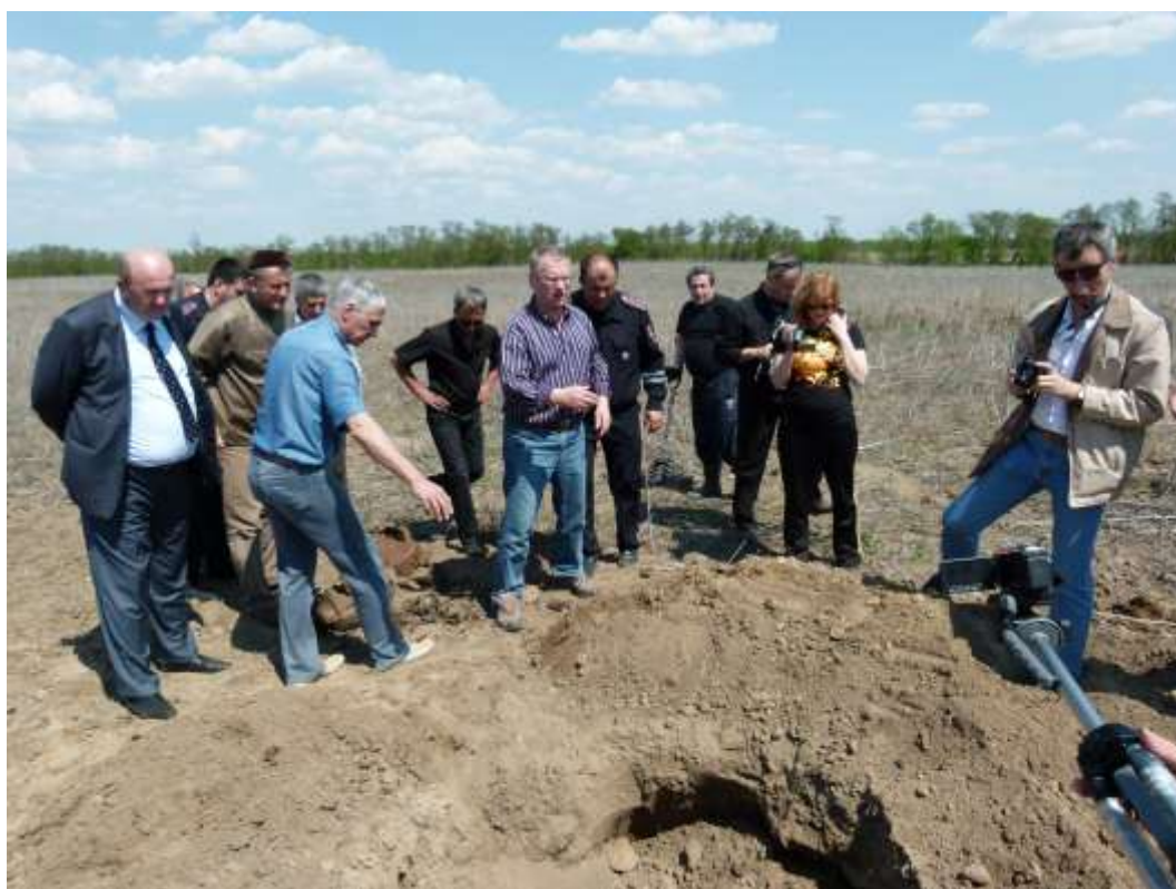
по местам ожесточенных боёв с фашистами в Чечне (Наурский р-н)