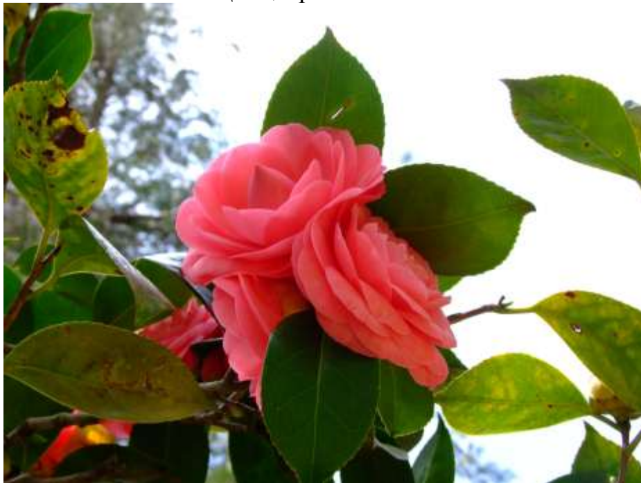
...а на берегу уже весна