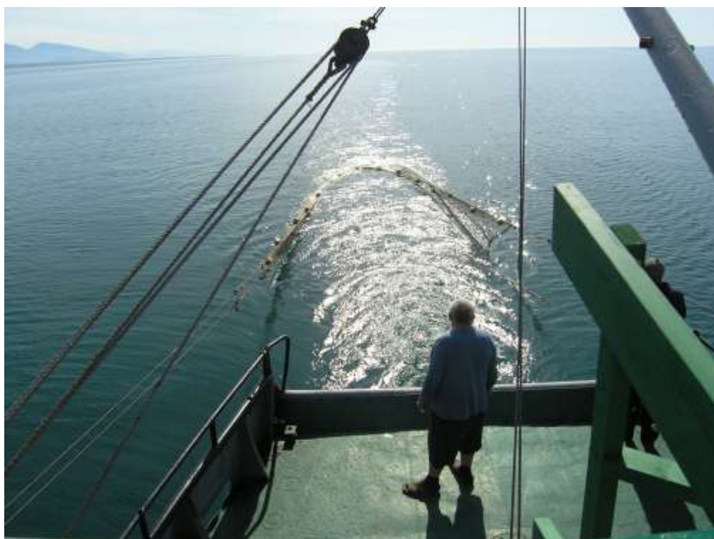
Капитан и Море (на фото Ткаченко В.И.)