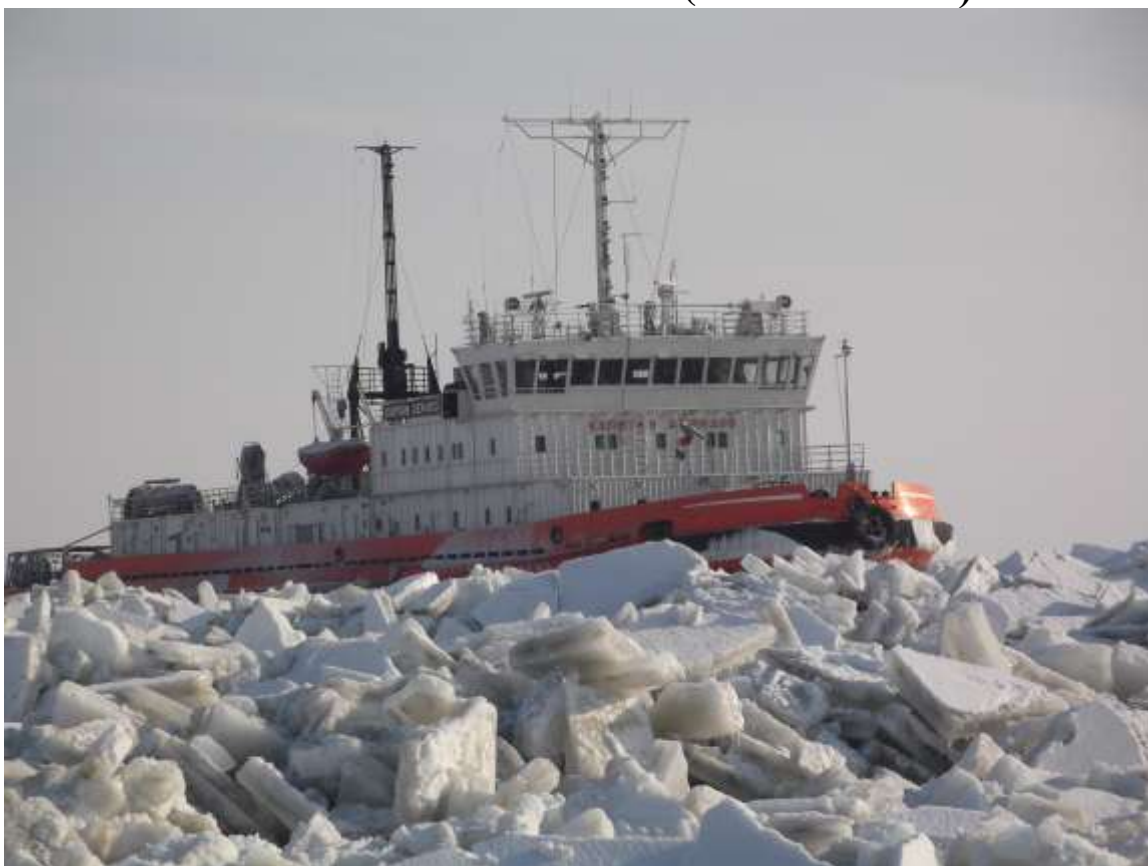
д/л «капитан Демидов» во льдах Азовского моря