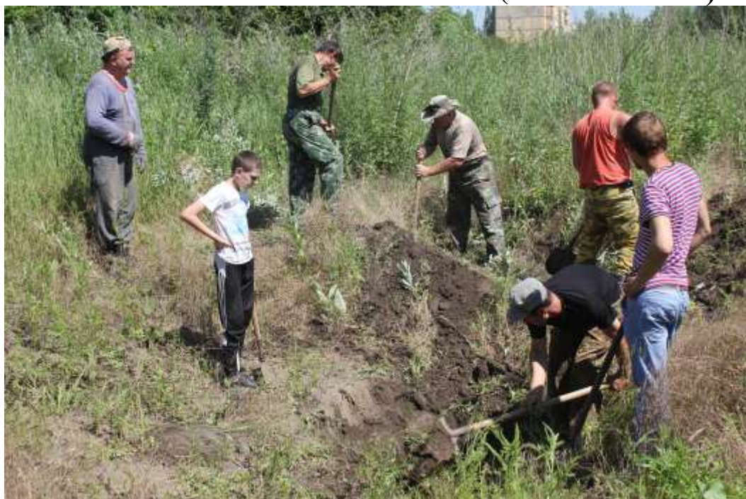
безымянные могилы советских бойцов в черте г. Крымск