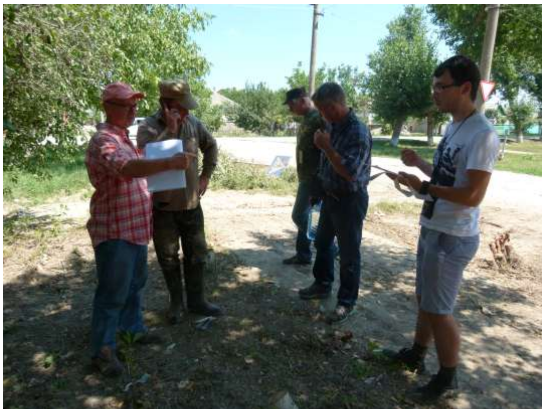
летучка в «поле»