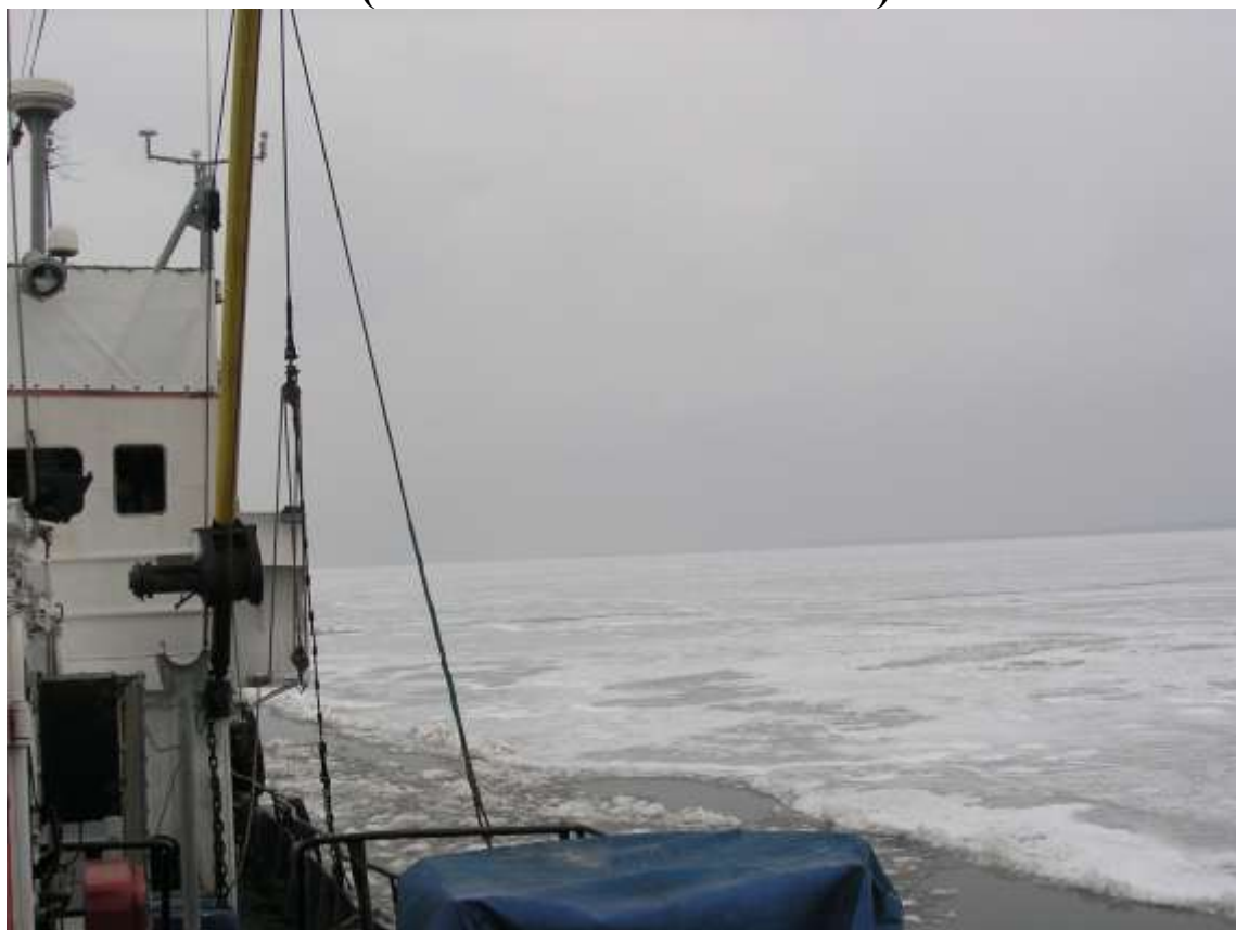
НИС «Денеб» во льдах Азовского моря