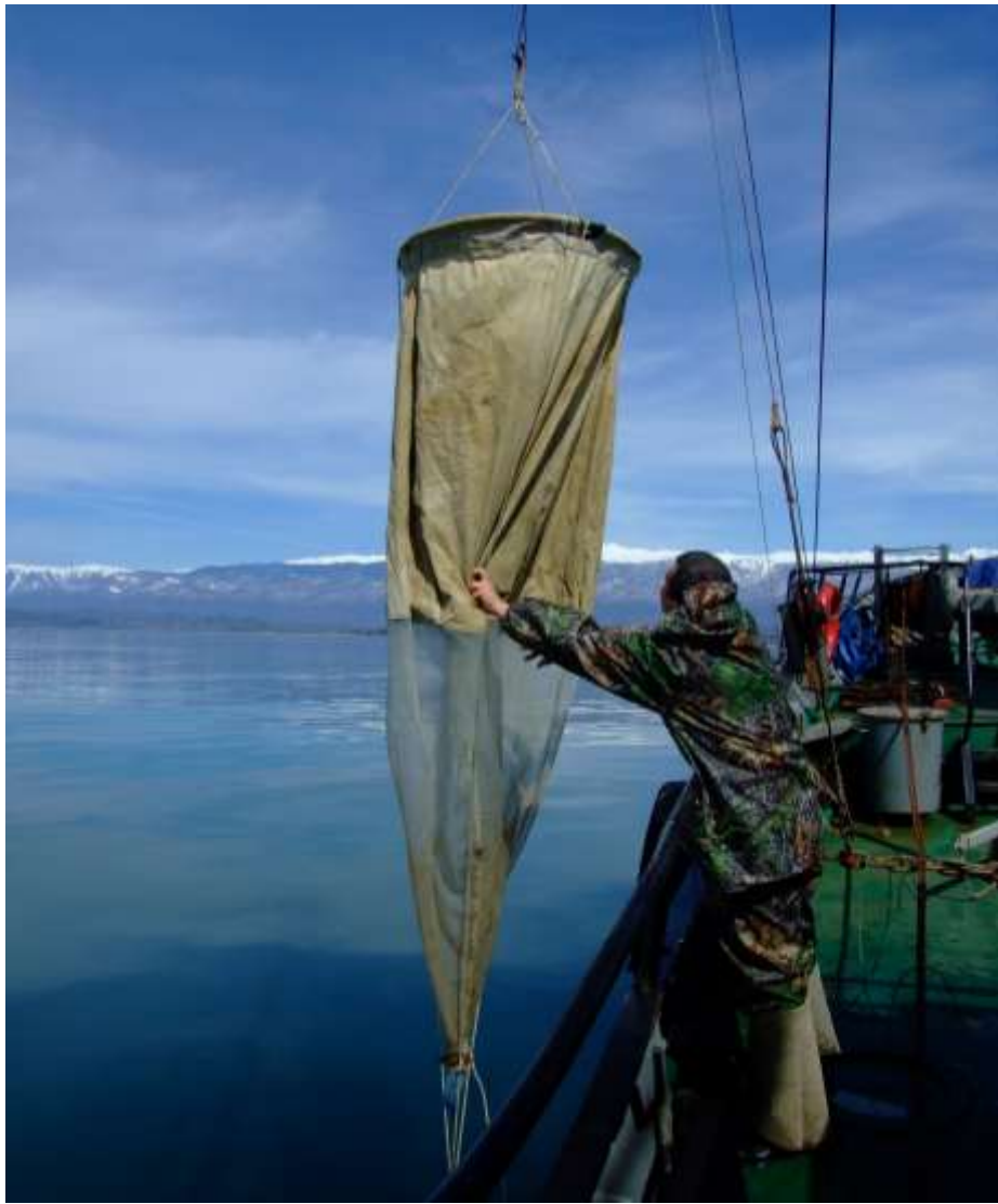
это не Шпицберген – это Абхазия!