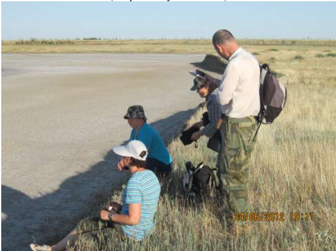
в поисках объекта исследований