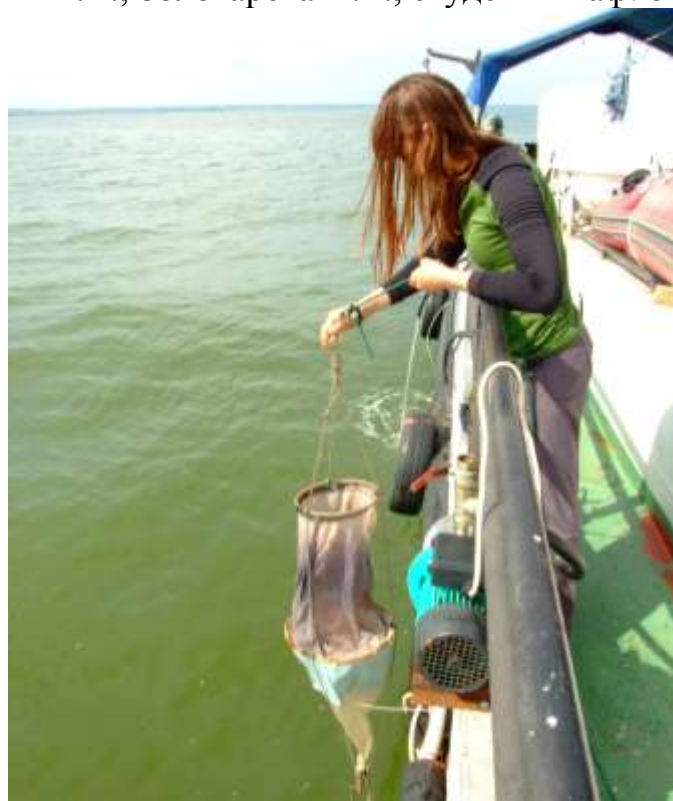
отбор проб планктона