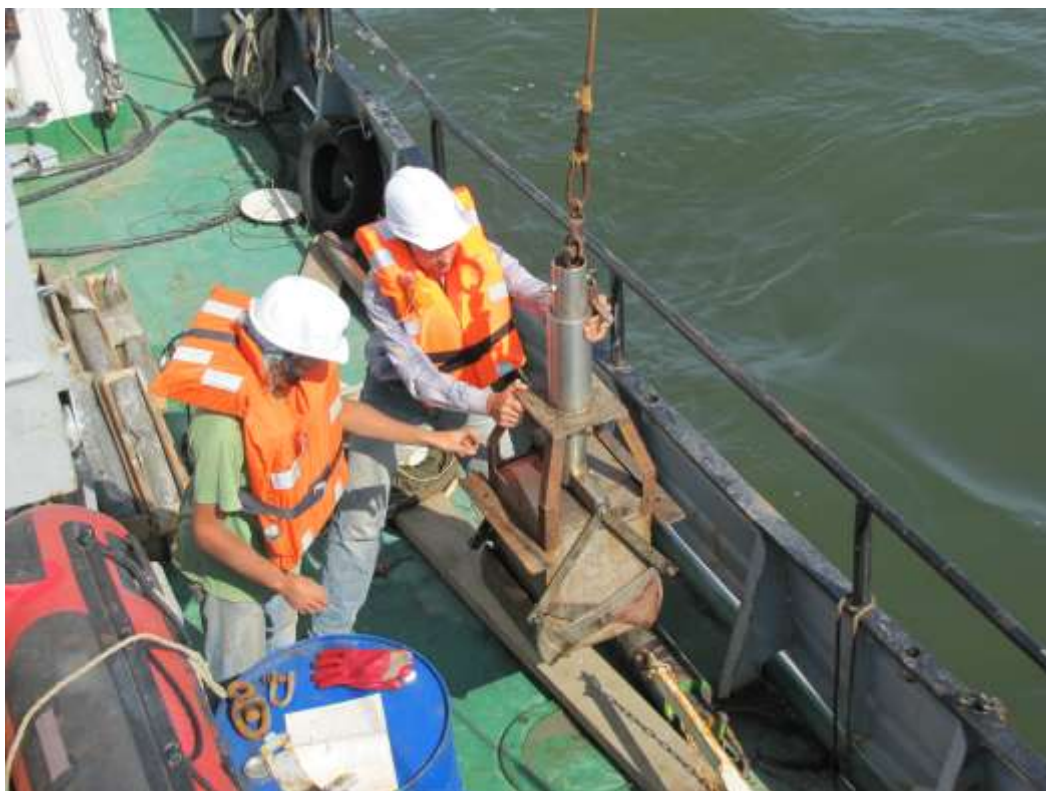
бокс-коррер в действии