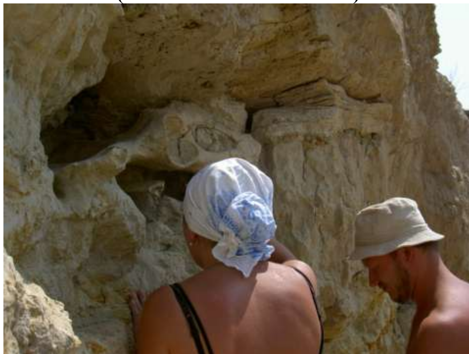
Раскопки таза мастодонта. Местонахождение Солнечнодольск (пос. Солнечнодольск, Ставропольский край) на фото Титов В.В.