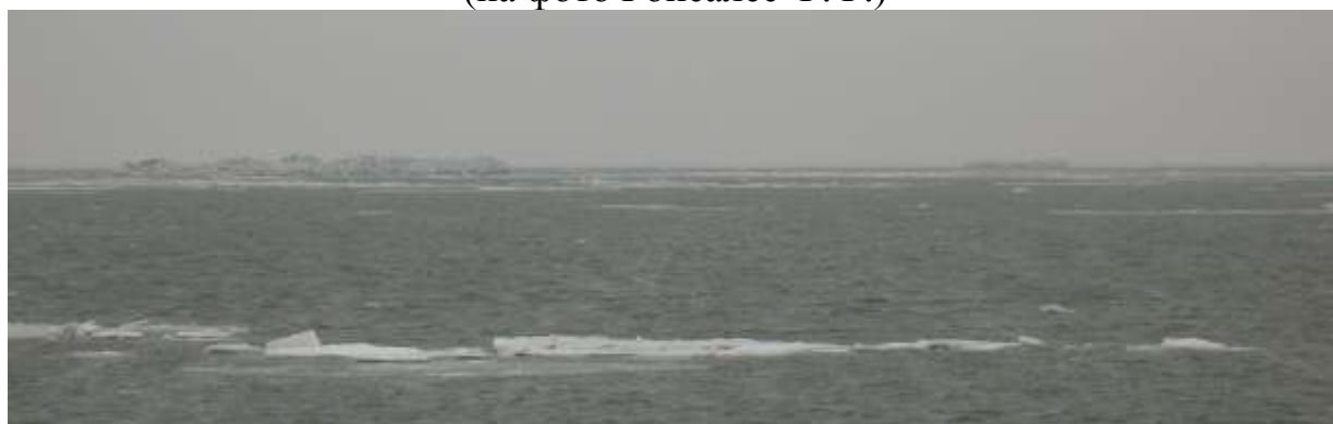
торосы или айсберги?