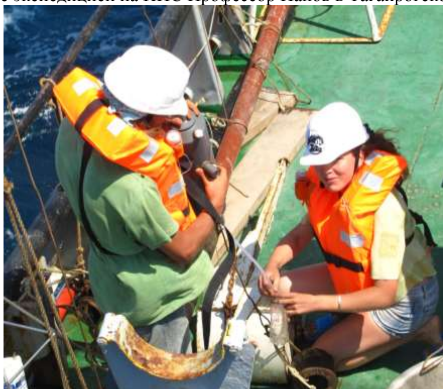
в палубных работах участвуют все!