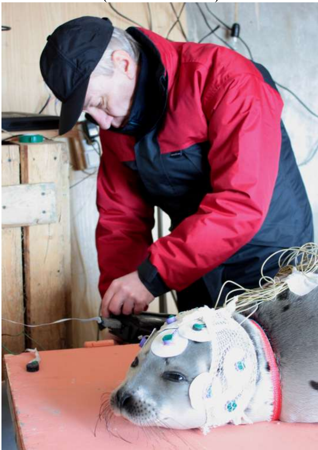
Добрый Доктор Ай-Вербицкий!