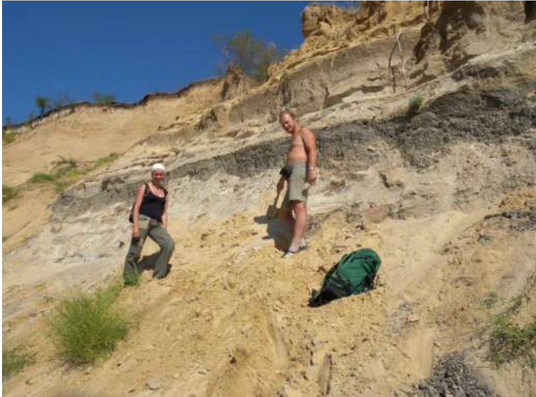
Позднеплейстоценовое местонахождение остатков беспозвоночных, крупных и мелких млекопитающих Вешенская (ст. Вёшенская, Шолоховский р-он, Ростовская область)