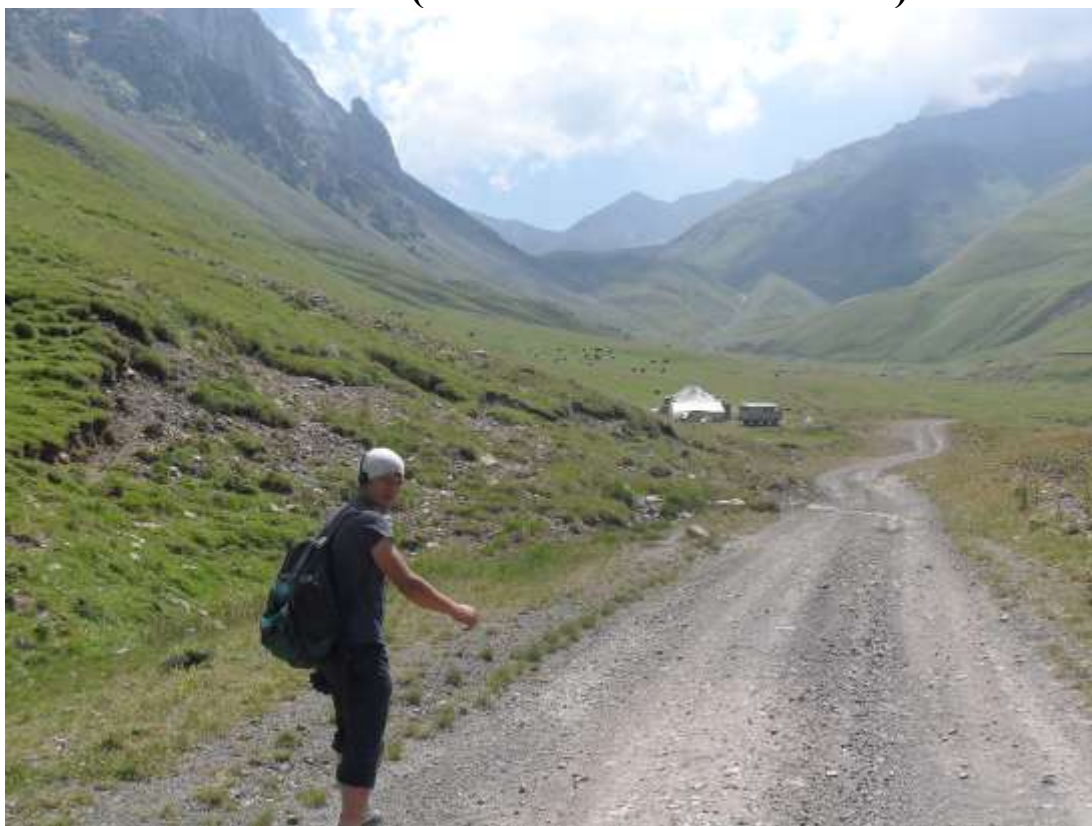
по дороге в лагерь