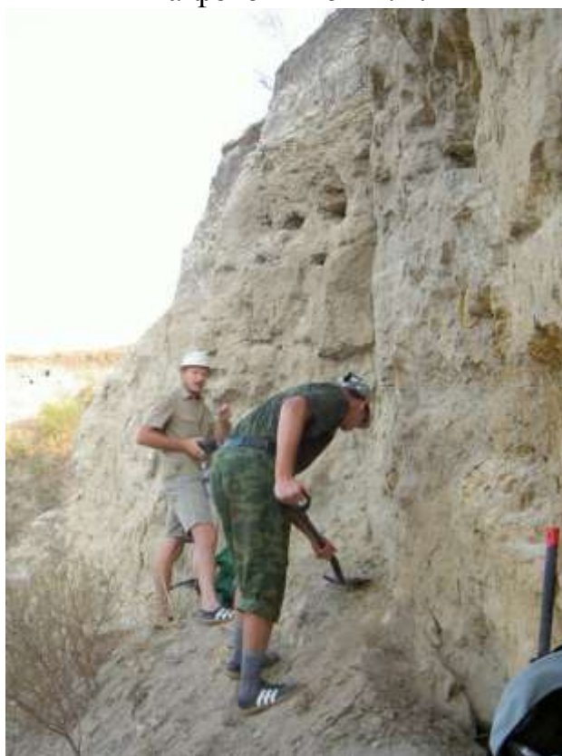
Работа на позднемиоценовом местонахождении Солнечнодольск (пос. Солнечнодольск, Ставропольский край)