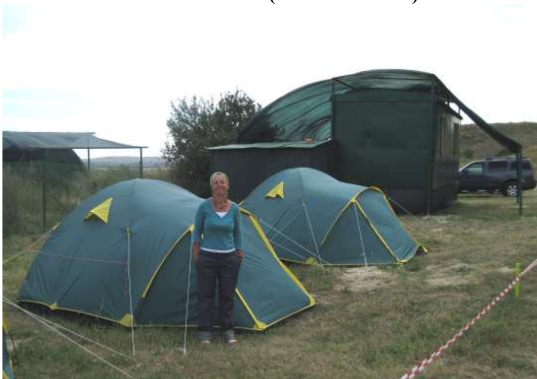
хороший быт – довольный археолог!