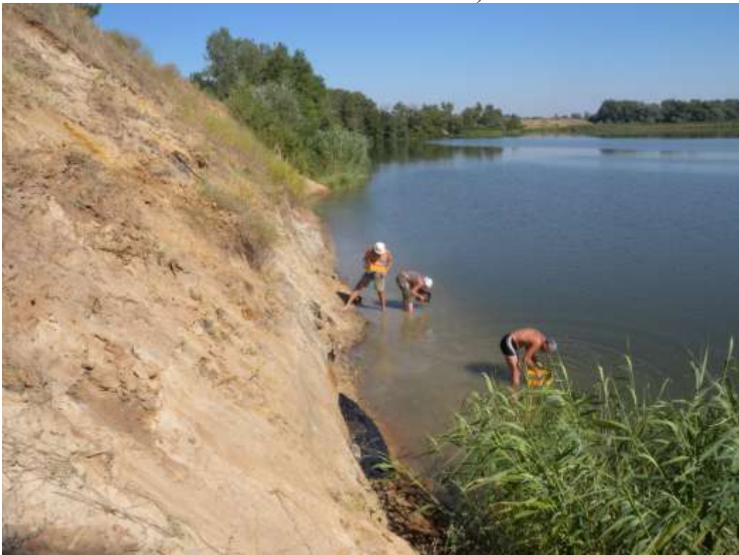
Позднеплейстоценовое местонахождение Синий Яр (р. Северский Донец, станица Усть-Быстрянская, Ростовская область). Совместные исследования вместе с ГИН РАН