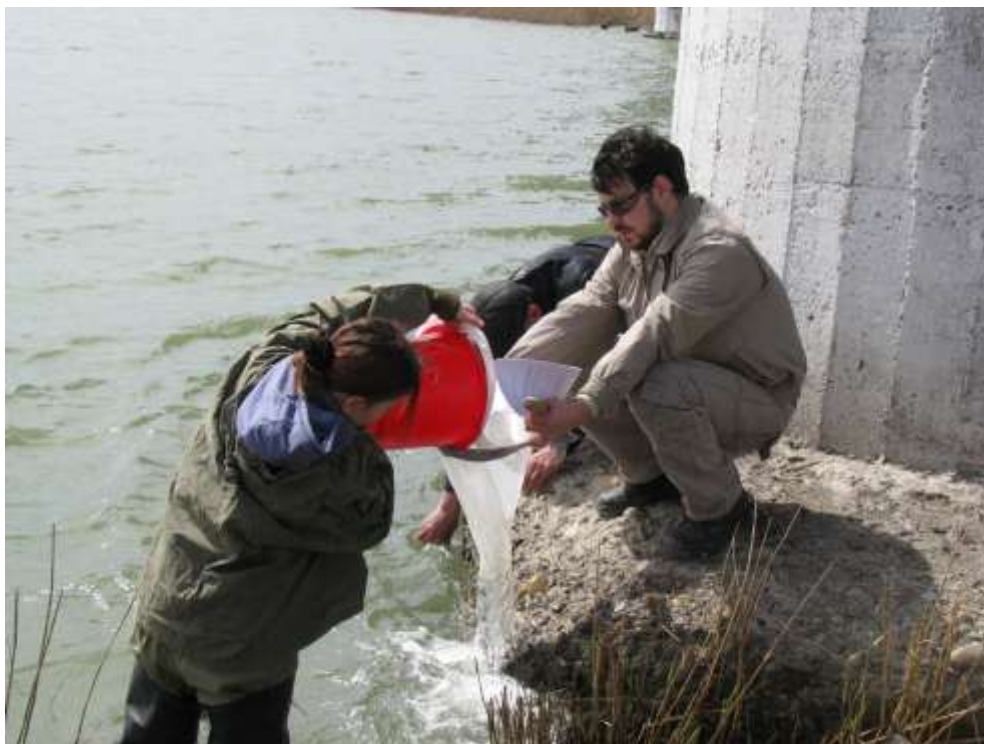
сотрудники ИАЗ ЮНЦ РАН и сеть Апштейна в действии!