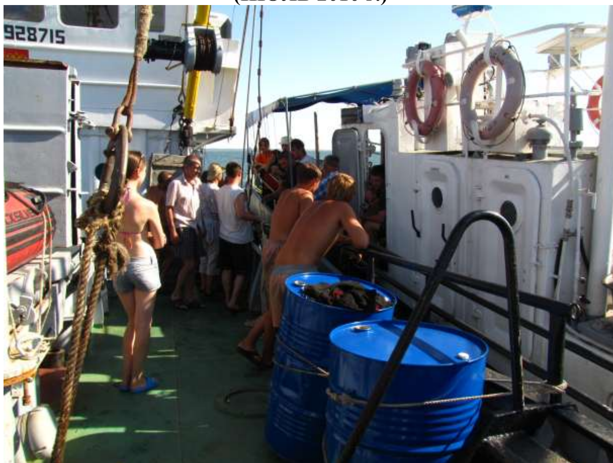
встреча с экспедицией на НИС Профессор Панов в Таганрогском заливе