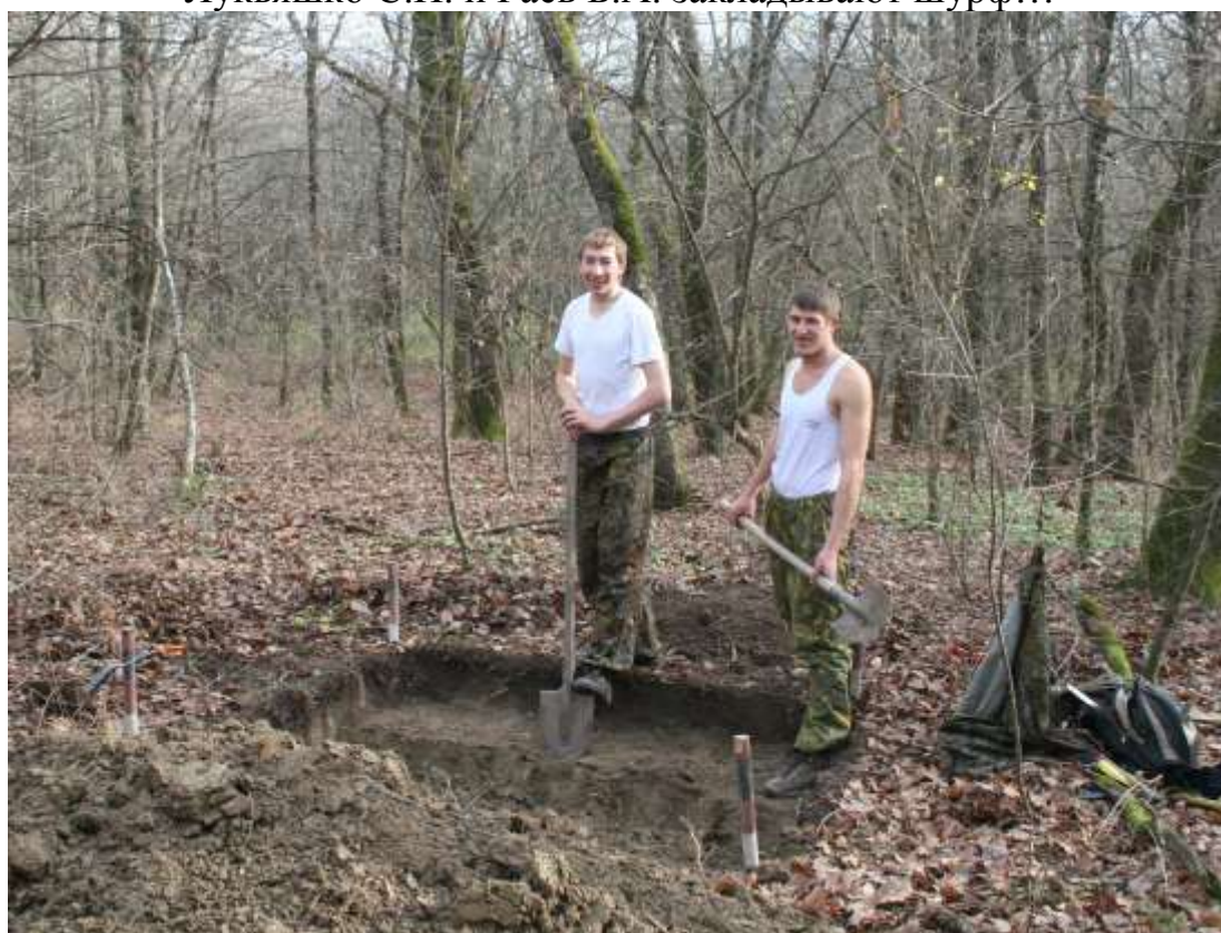
...молодые археологи изучают полевой опыт!