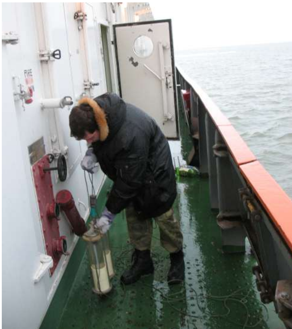
подготовка батометра Молчанова к работе (на фото Гонсалес Ф.Ф.)