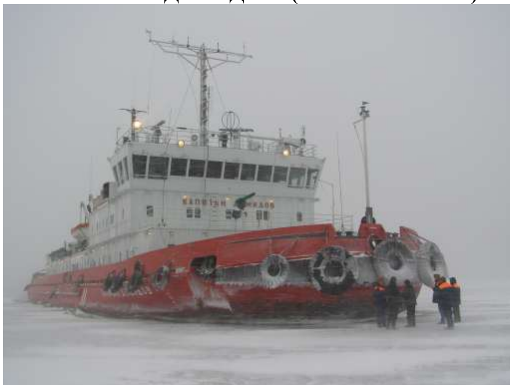
ледокол «Капитан Демидов»