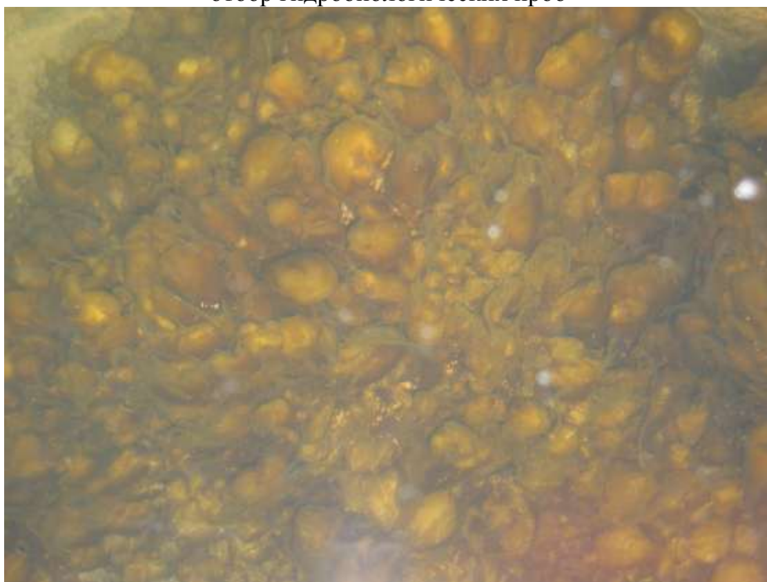
массовое развитие бентосных сине-зеленых водорослей