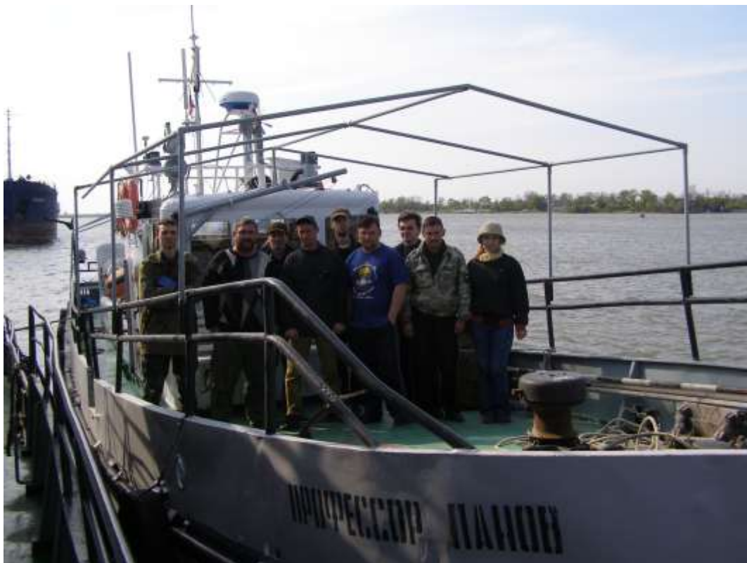
научная группа и команда НИС «Профессор Панов»