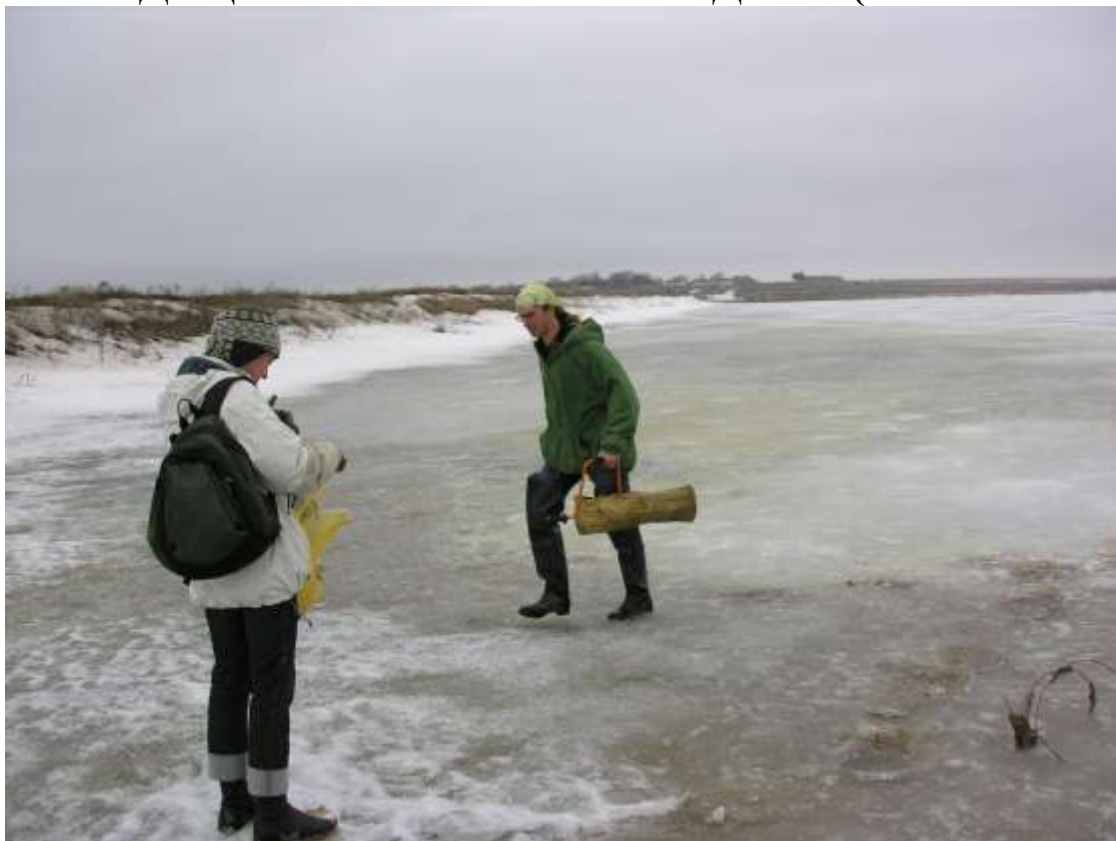
отбор гидробиологических проб