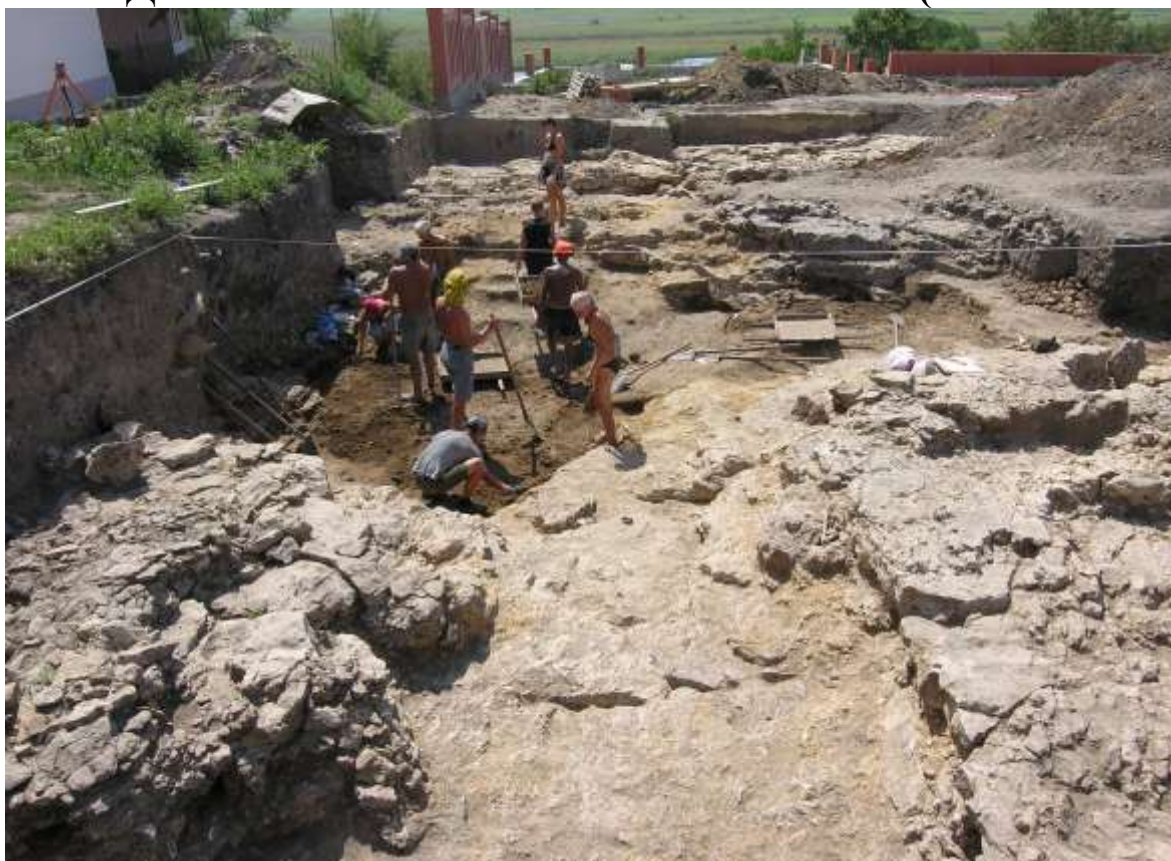
каждое лето на раскопках....