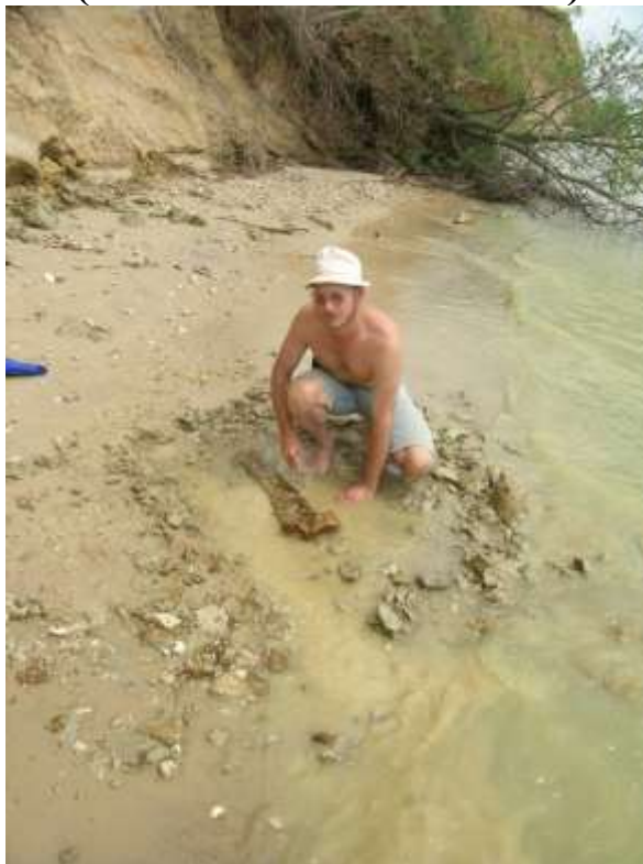
Раскопки кости южного слона. Цимлянское водохранилище (окрестности г. Цимлянска, Ростовская обл.)