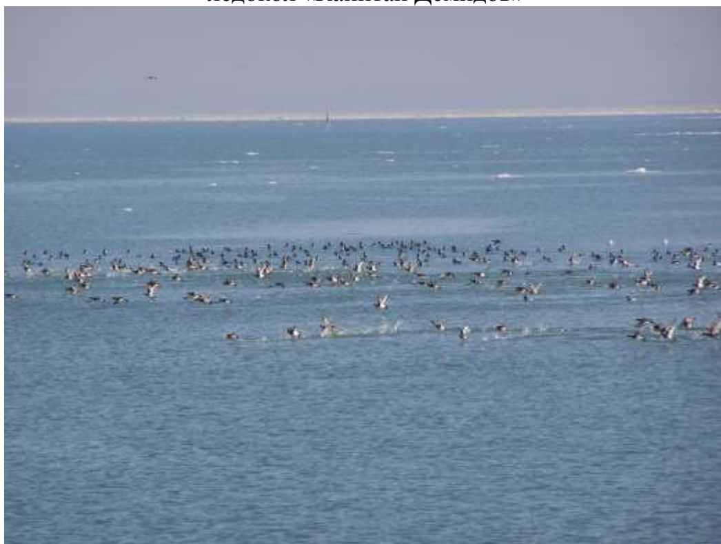
скопления птиц в Керченском проливе