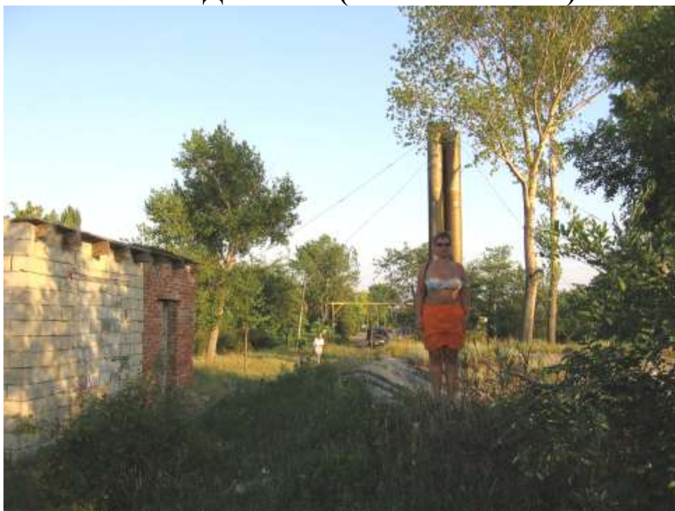
проведение GPS-картирования на западной окраине с. Воронцовка (на фото Е.С. Матишова)