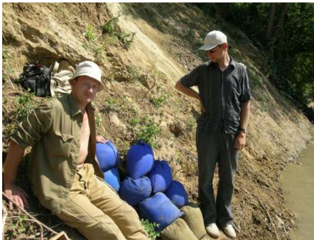
Отобранная порода в ожидании промывки. Береговой обрыв р. Лаба