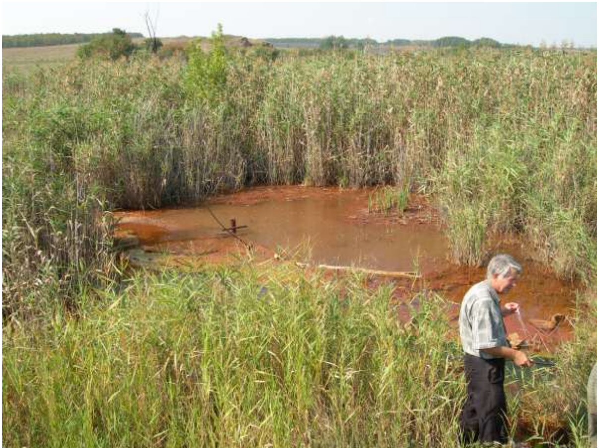
обследование выход шахтных вод