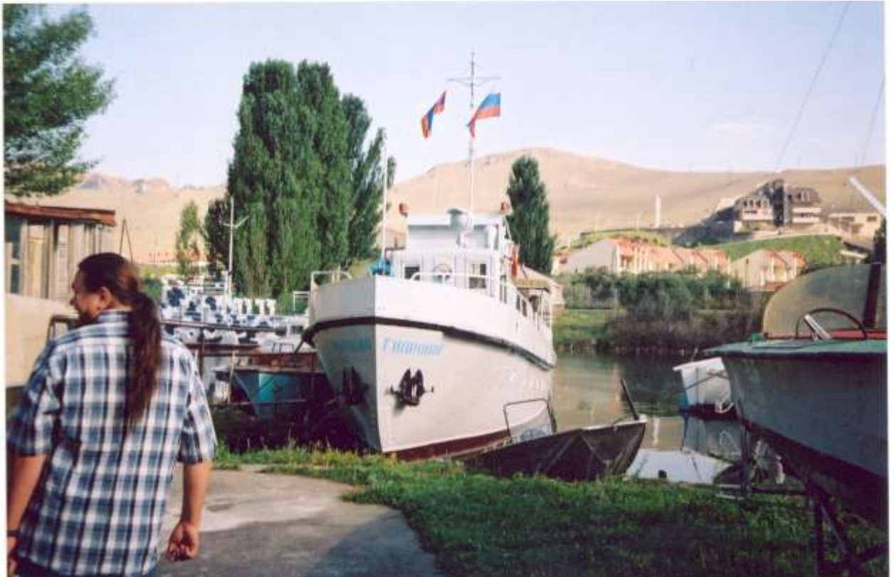
НИС «Гидробиолог» (в 2005 г. судно передано Российской академией наук в дар Национальной академии наук Армении)