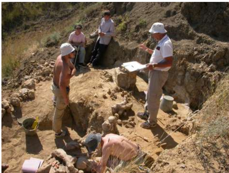
Местонахождение Синяя Балка/Богатыри (Темрюкский р-он, Краснодарский край). Совместные работы с сотрудниками ИИМК РАН и ГИН РАН