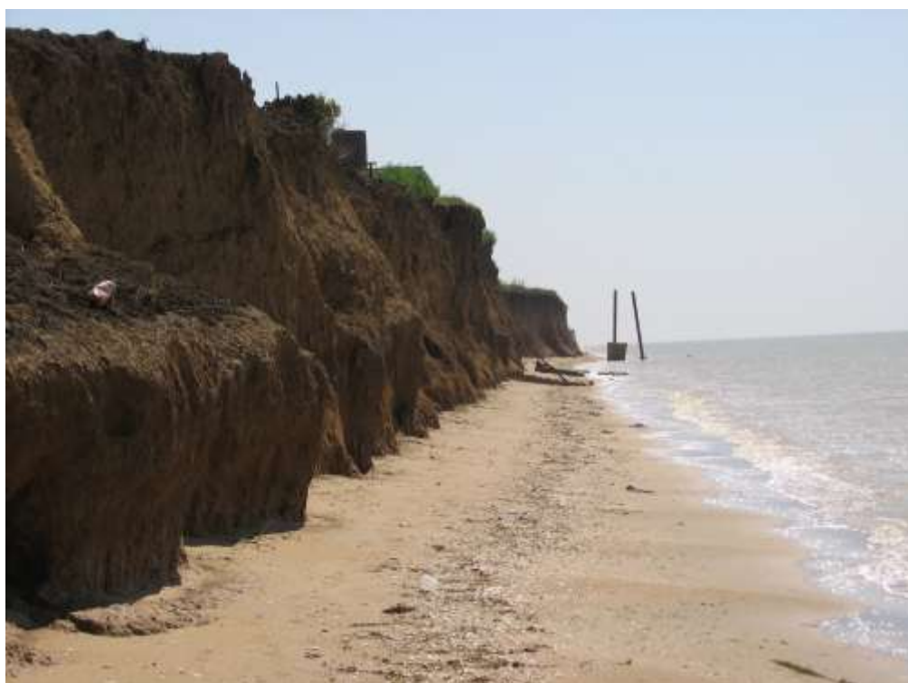
исследования абразии берегов в районе косы Долгой