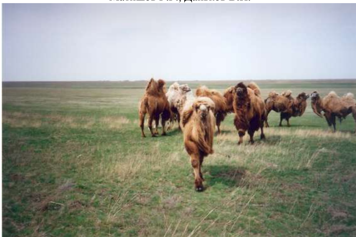
корабли пустыни и степи