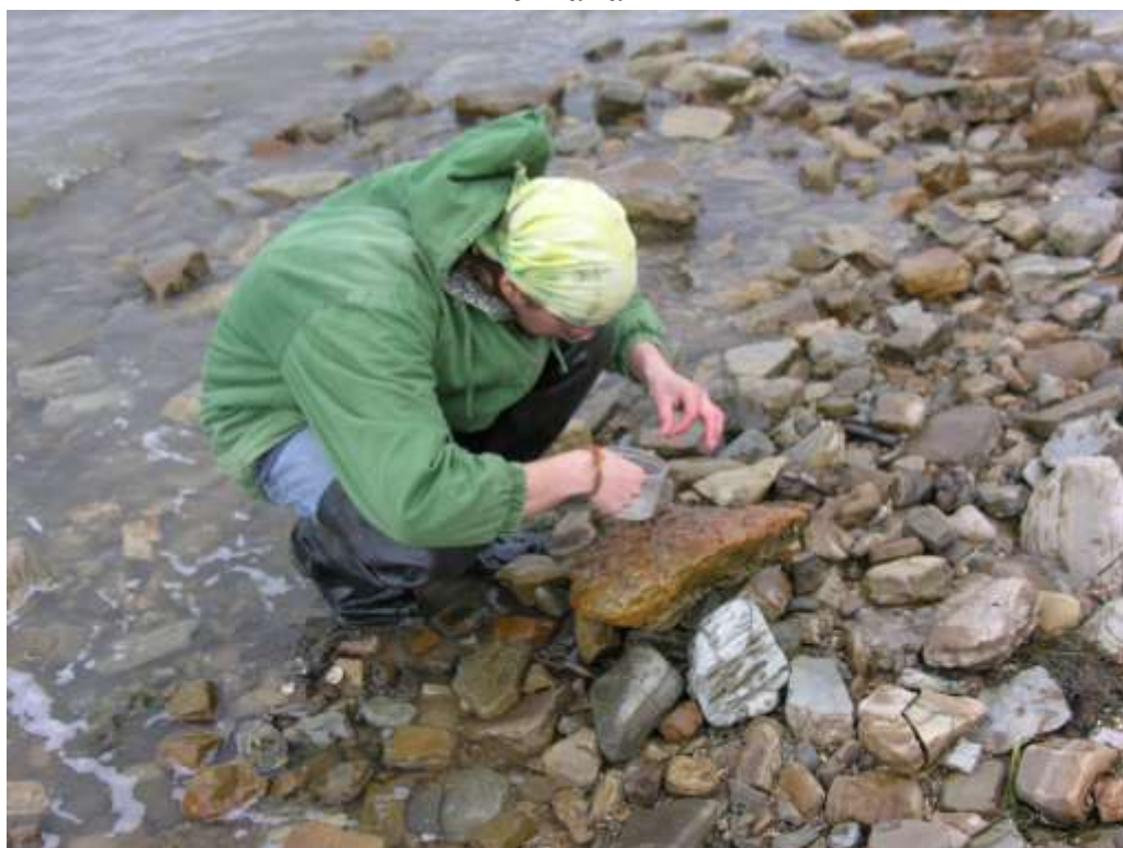
сбор беспозвоночных в зоне заплеска