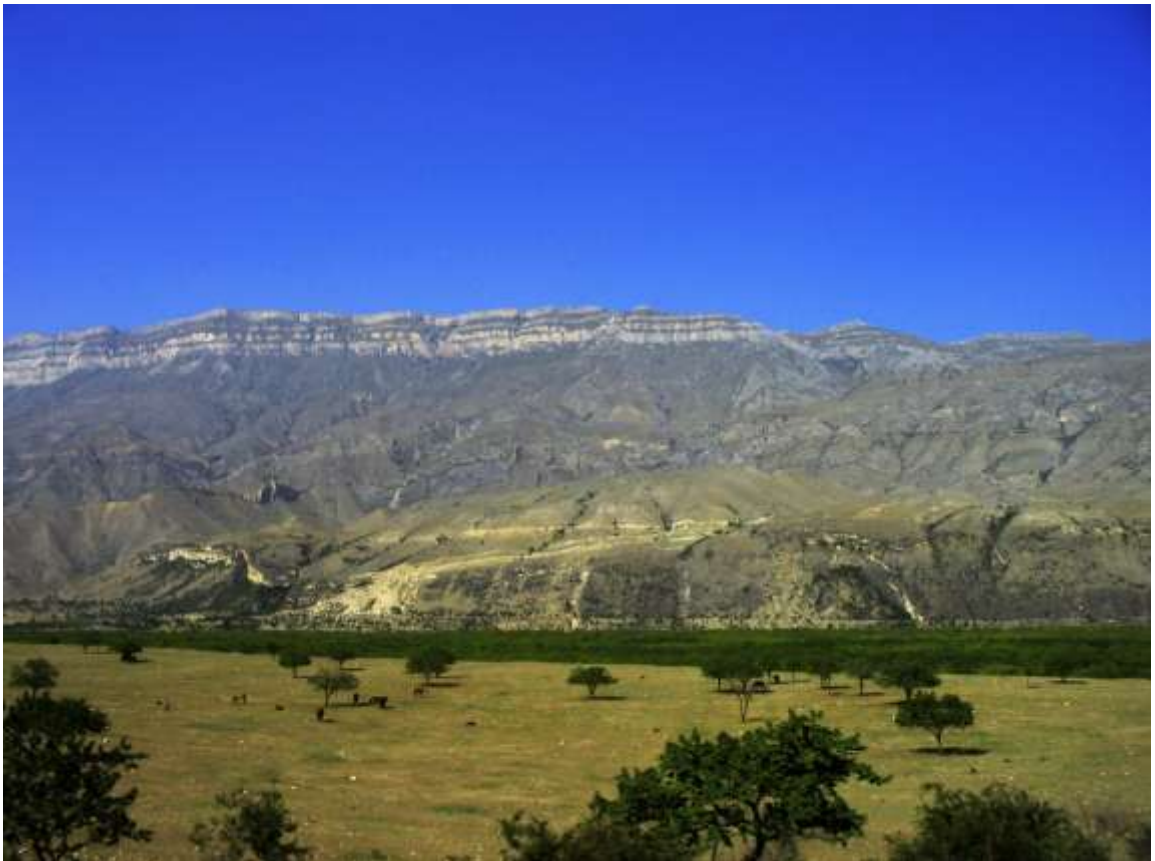
это не Африка...