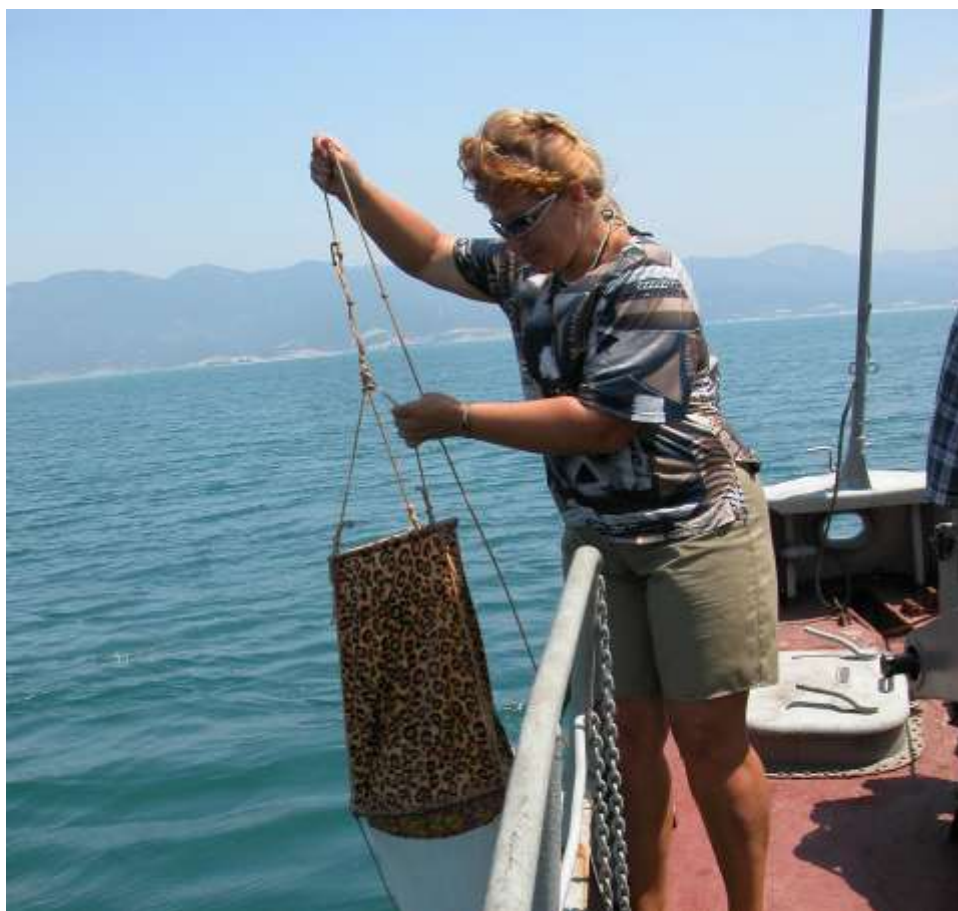
отбор проб сетного планктона