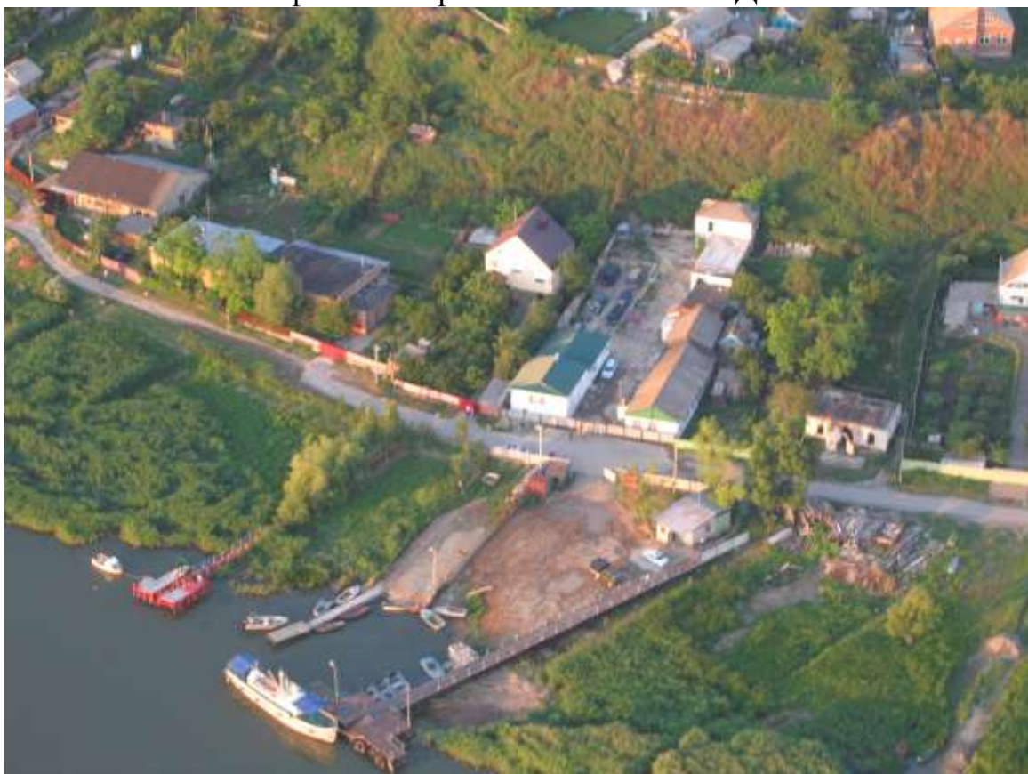
НЭБ «Кагальник» с высоты «птичьего» полета