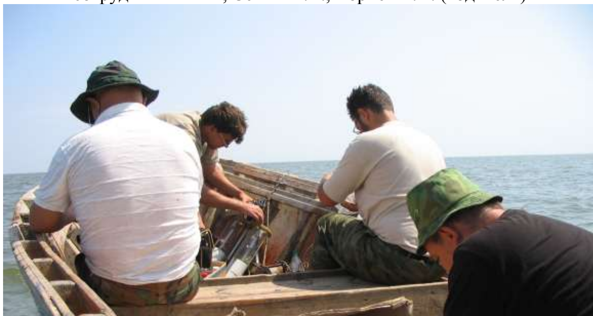
подготовка к отбору гидробиологических проб в Кизлярском заливе