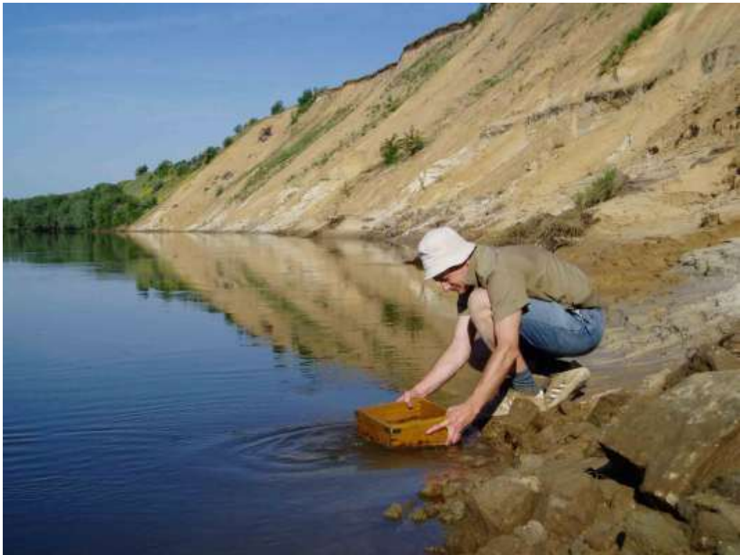
Промывка породы с целью поиска остатков мелких млекопитающих. Окрестности ст. Вёшенская (Шолоховский р-он, Ростовская обл.)