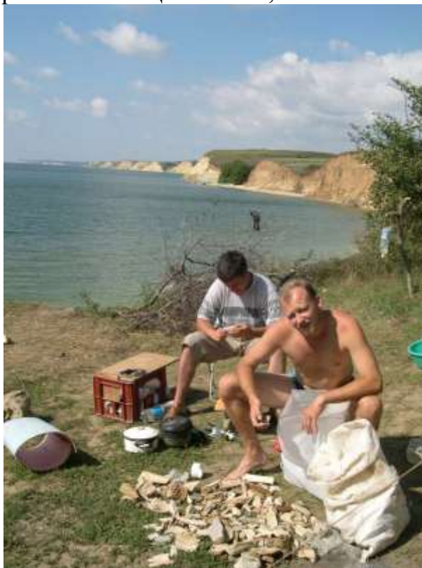
Сортировка собранного палеонтологического материала (окрестности г. Цимлянска, Ростовская обл.)