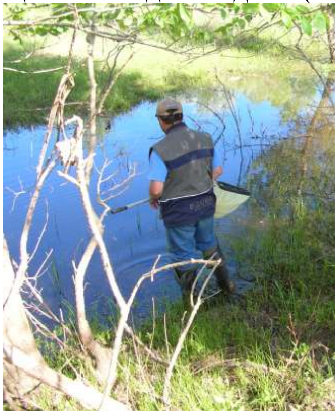
ихтиолог в засаде (на фото Лужняк В.А.)