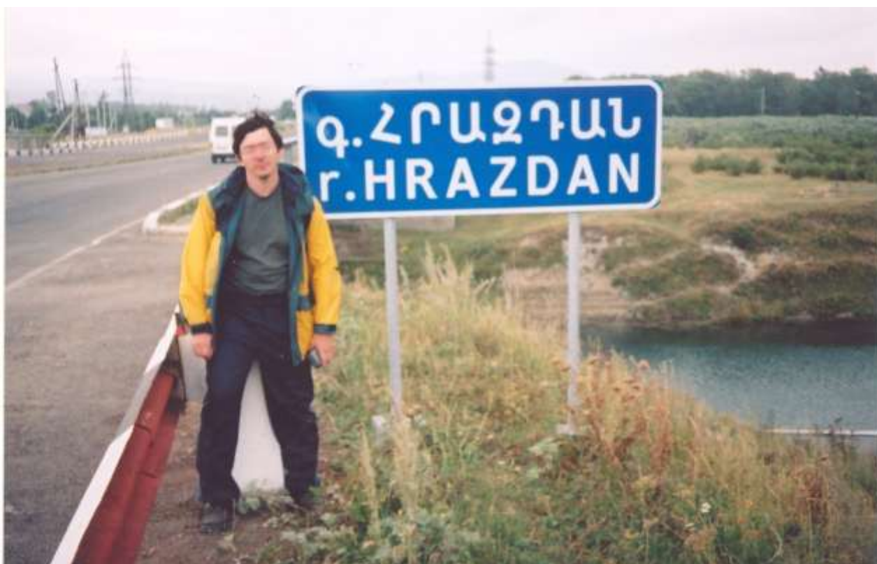
у реки Раздан