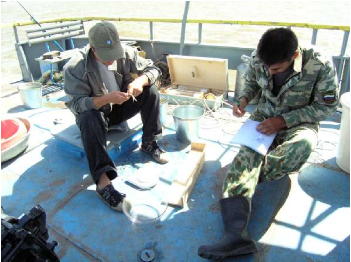
Полный биологический анализ улова