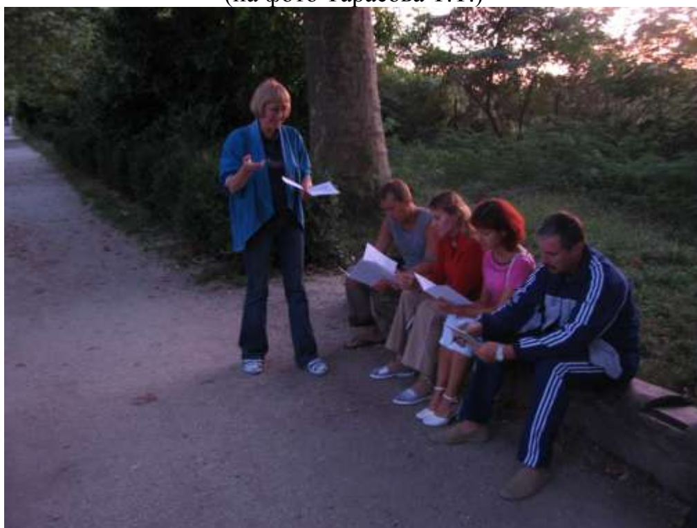
вечерняя летучка и обсуждение результатов работы