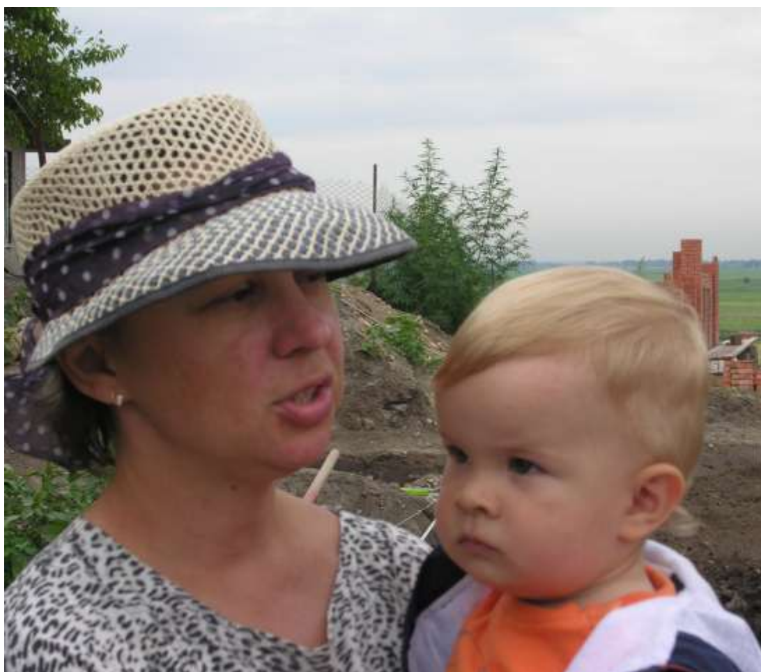
последние указания перед раскопками!