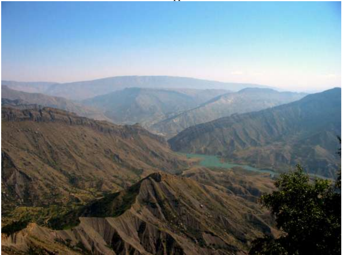
... это горный Дагестан