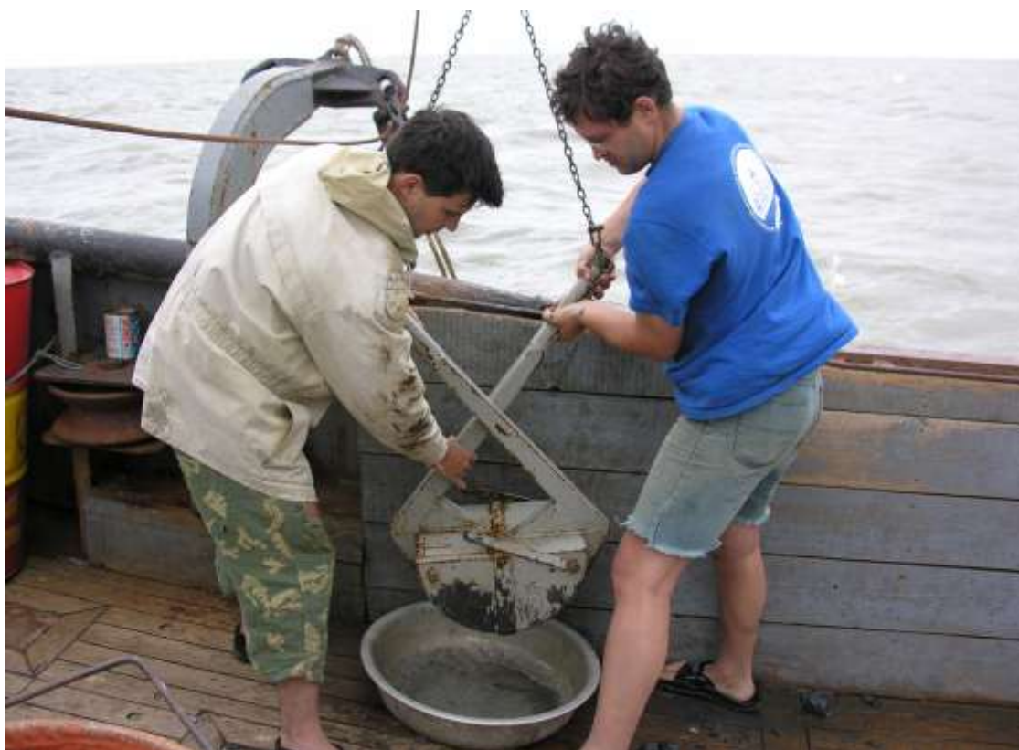
отбор проб бентоса