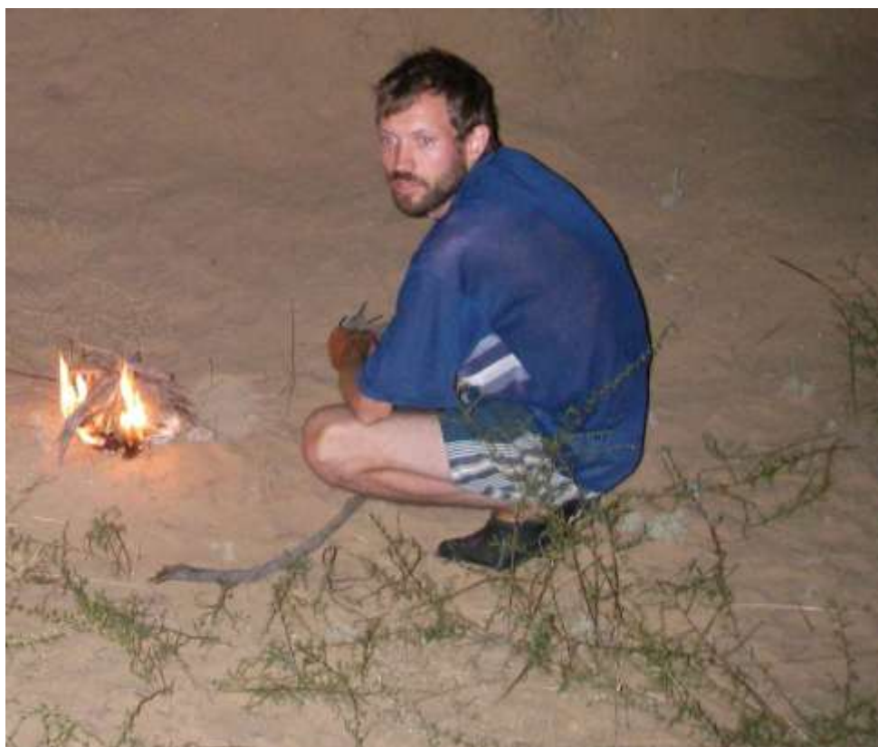
приготовление пищи в полевых условиях (на фото Ю.А. Ребриев)