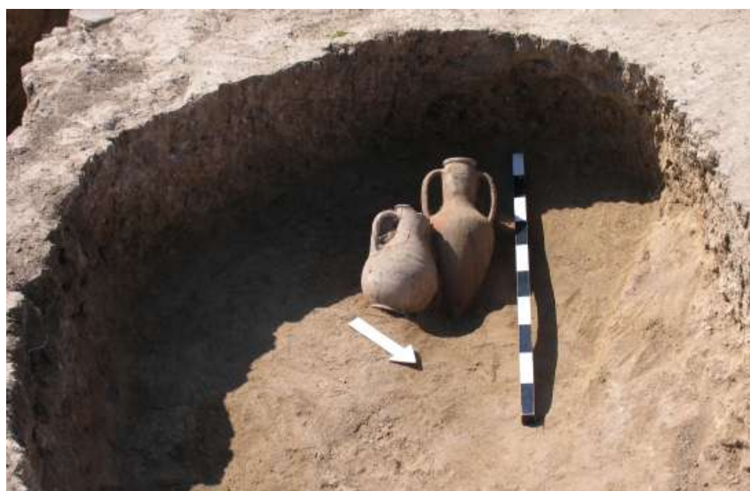
и вот результат!