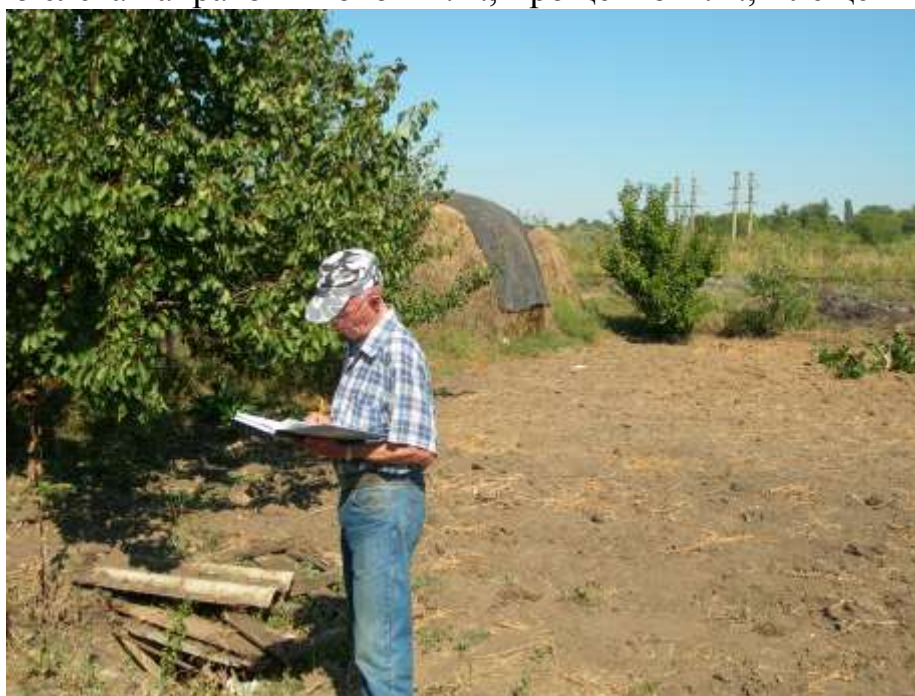
обследование заброшенных колодцев