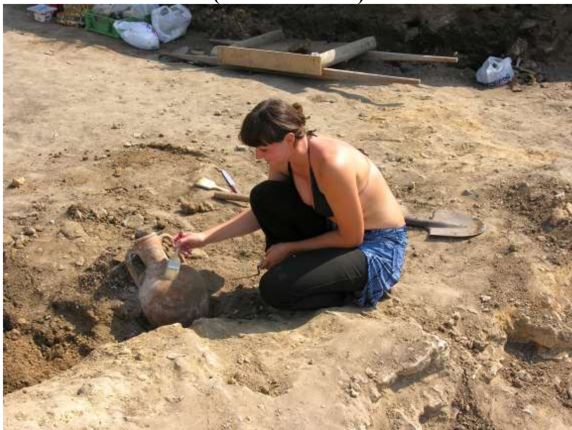
археолог за работой