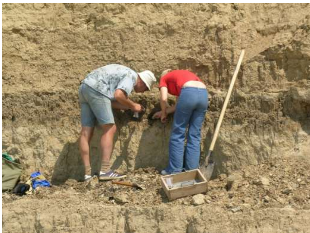
Выкапывание кости среднеплейстоценового бизона (пос. Платово, Неклиновский р-он, Ростовская обл.)