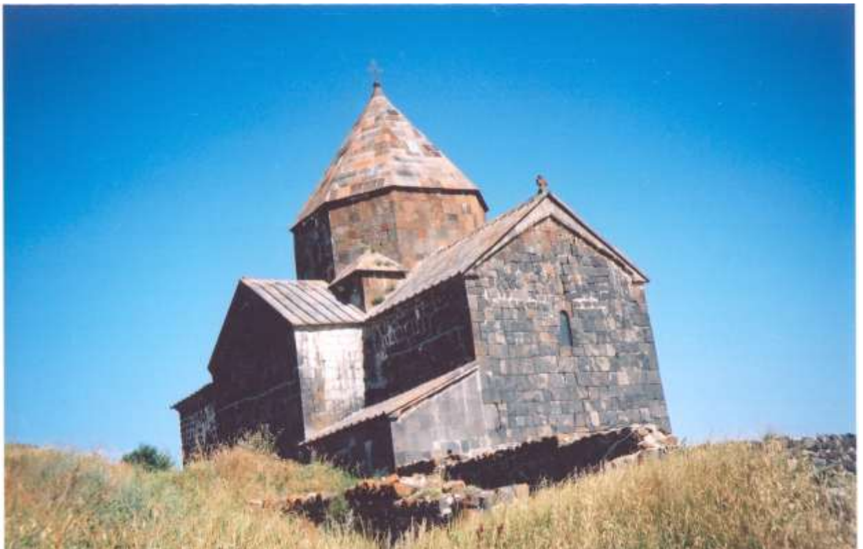
Древняя армянская церковь на берегу Севана